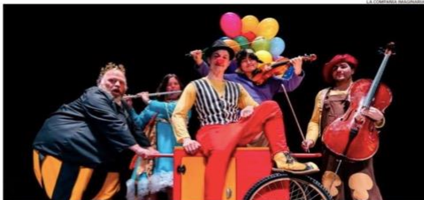
MÚSICA EN VIVO Y LA PROMOCIÓN DE LA ALIMENTACIÓN SALUDABLE SON ALGUNOS DE LOS ELEMENTOS DISTINTIVOS DE LA PROPUESTA CREATIVA.